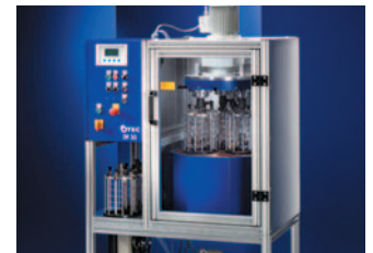
Schleppfinishmaschine DF Drag-finishing machine DF