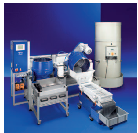
M50 im Betrieb | M50 at work