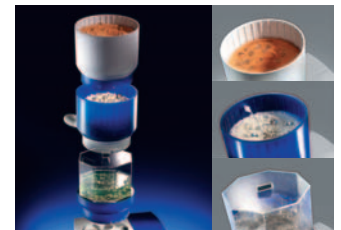
Tellerfliehkraftmaschine ECO-Maxi Disc-finishing machine ECO-Maxi