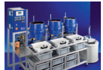
Tellerfliehkraftmaschine CF Disc-finishing machine CF